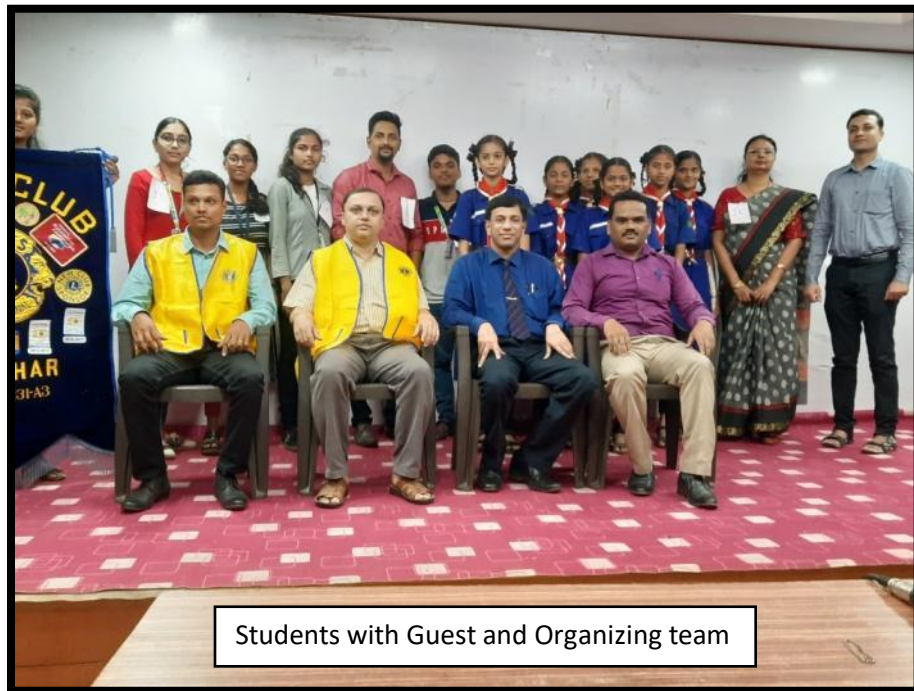
Students with Guest and Organizing team